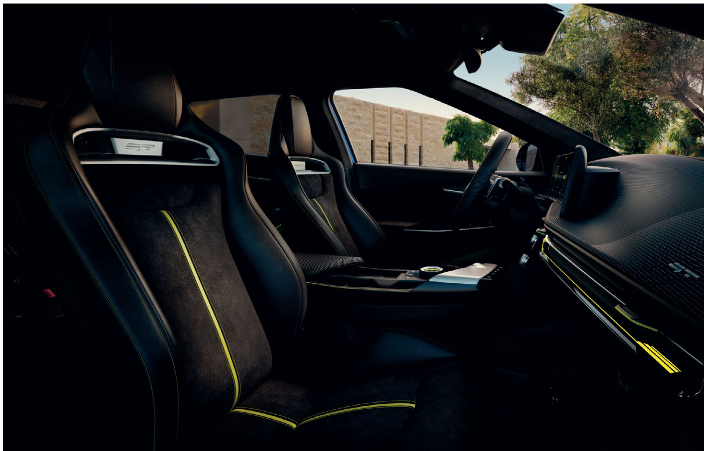
Alcantarou čalúnené športové sedadlá s logom GT