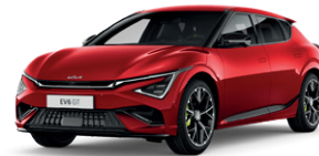
Runway Red (metalický lak bez príplatku)