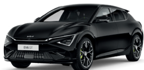
Aurora Black Pearl (perleťový lak)