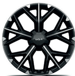
21-palcové disky kolies z ľahkých zliatin (pneumatiky 255/40 R21)