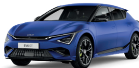
Yacht Blue (matný lak)