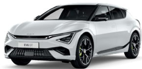
Snow White Pearl (perleťový lak)